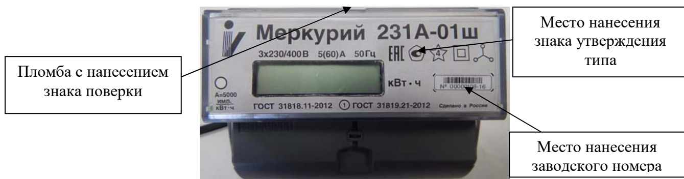
Рисунок 3 – Общий вид счетчиков «Меркурий 231А-0Хш» с указанием места ограничения доступа к местам настройки (регулировки), места нанесения знака утверждения типа, места нанесения заводского номера