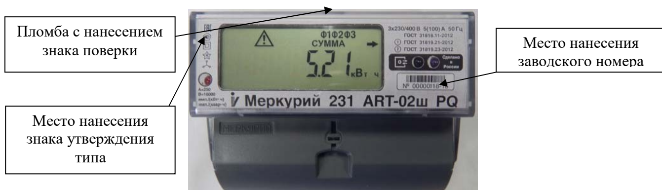
Рисунок 5 – Общий вид счетчиков «Меркурий 231А(Р)Т-0Хш» с указанием места ограничения доступа к местам настройки (регулировки), места нанесения знака утверждения типа, места нанесения заводского номера

Счётчики предназначены для эксплуатации внутри закрытых помещений.