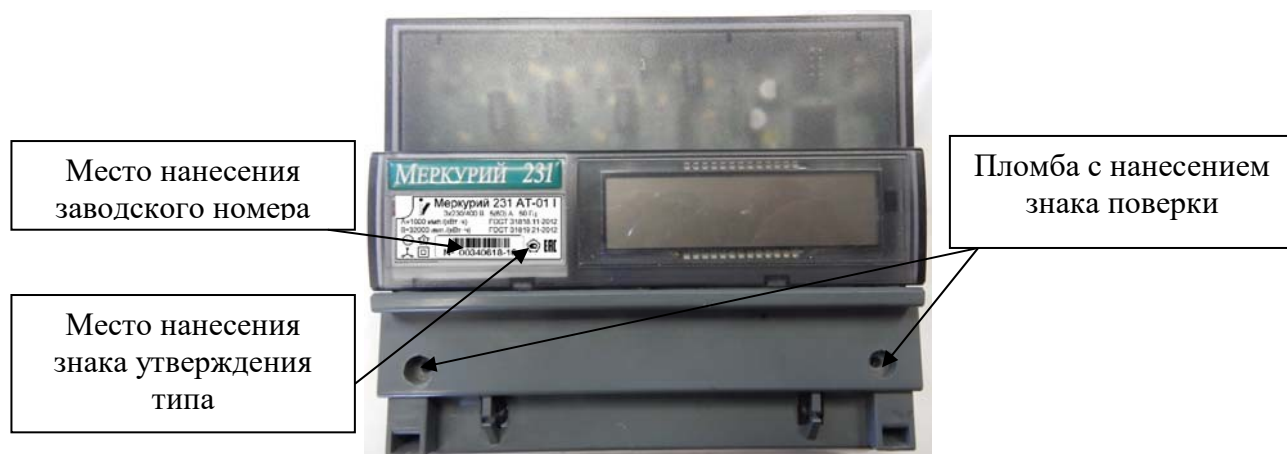
Рисунок 4 – Общий вид счетчиков «Меркурий 231А(Р)(Т)-0Х» с указанием места ограничения доступа к местам настройки (регулировки), места нанесения знака утверждения типа, места нанесения заводского номера