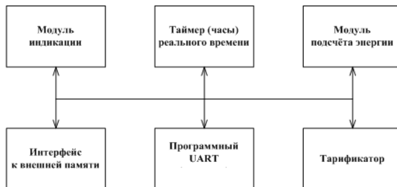
Рисунок 6 – Структура программного обеспечения «Меркурий 231»

Уровень защиты программного обеспечения «высокий» в соответствии с Р 50.2.077-2014.