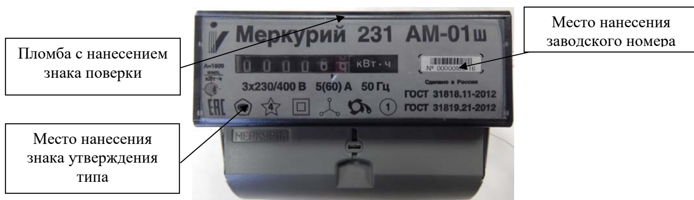
Рисунок 2 – Общий вид счетчиков «Меркурий 231АМ-0Хш» с указанием места ограничения доступа к местам настройки (регулировки), места нанесения знака утверждения типа, места нанесения заводского номера