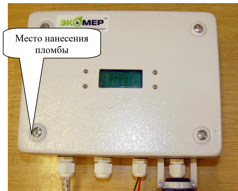
Рисунок 3 - Схема пломбирования газоанализатора ИКТС-11 исполнения ИКТС-11.М от несанкционированного доступа.