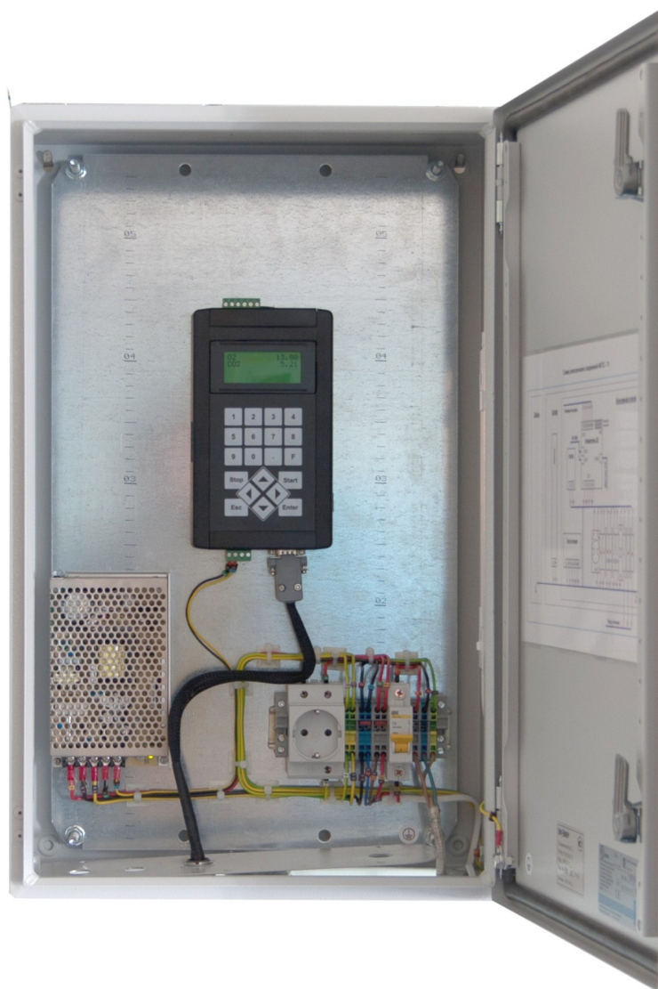
Рисунок 1 – Внешний вид газоанализатора ИКТС исполнения ИКТС 11 и ИКТС 11.1.