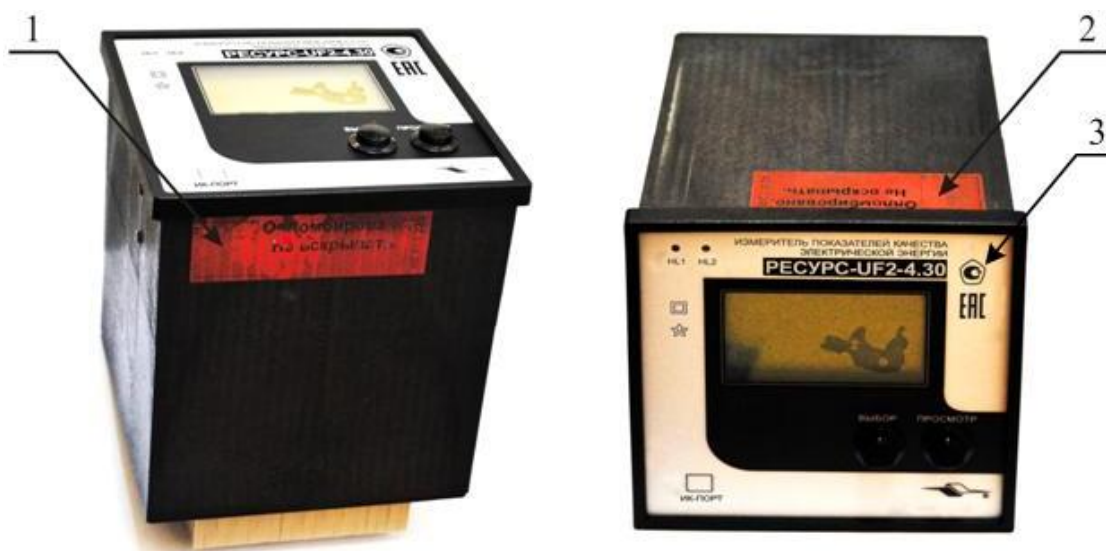
Рисунок 1 – Общий вид и схема пломбировки от несанкционированного доступа приборов «Ресурс-UF2-4.30-X-X-н-XXX»