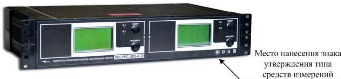
Рисунок 4 – Общий вид приборов «Ресурс-UF2-4.30-X-X-2с-XXX»