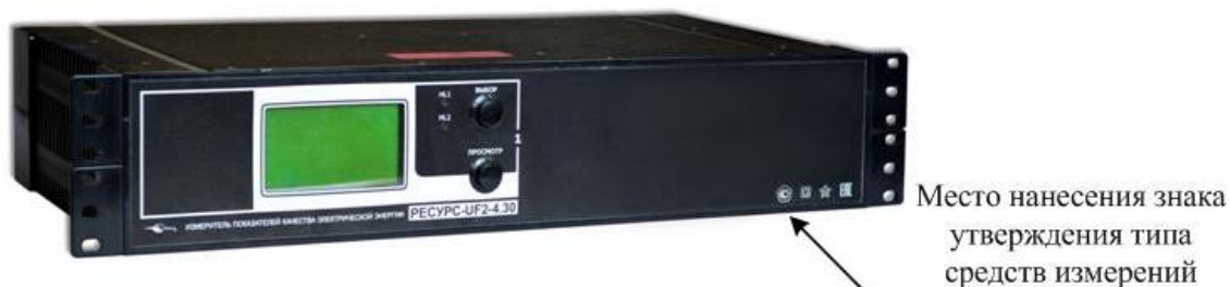
Рисунок 3 – Общий вид приборов «Ресурс-UF2-4.30-X-X-с-XXX»