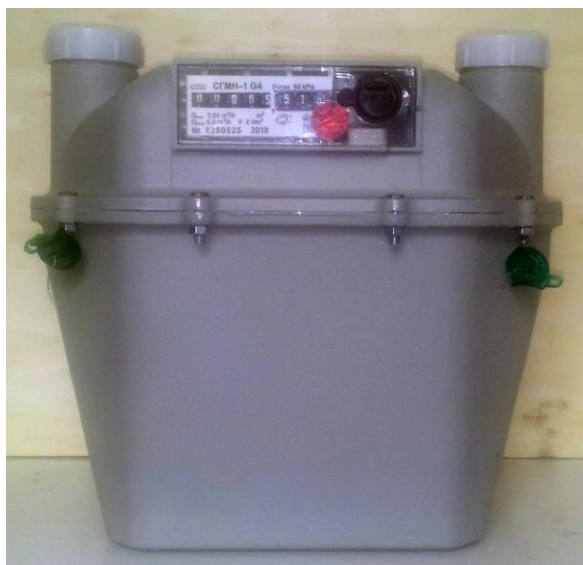
а) Общий вид счетчиков газа СГМН-1-х-х-Gx