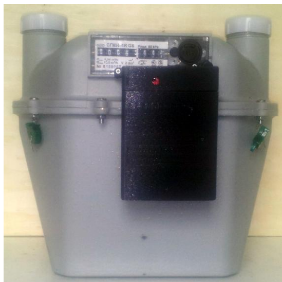
в) Общий вид счетчиков газа СГМН-1R-х-х-Gx