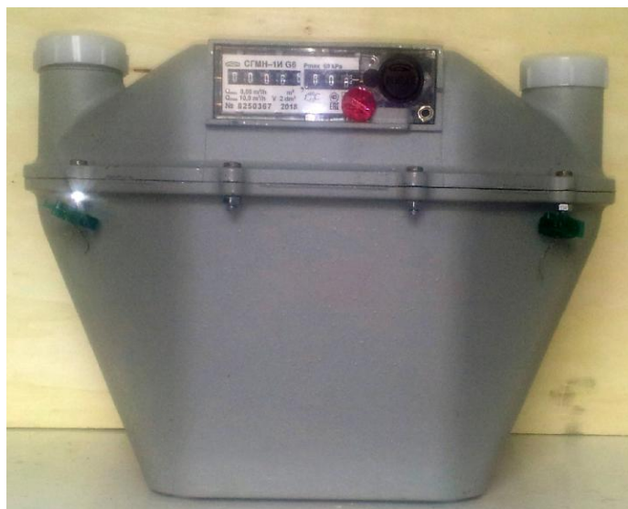
б) Общий вид счетчиков газа СГМН-1И-х-х-Gx