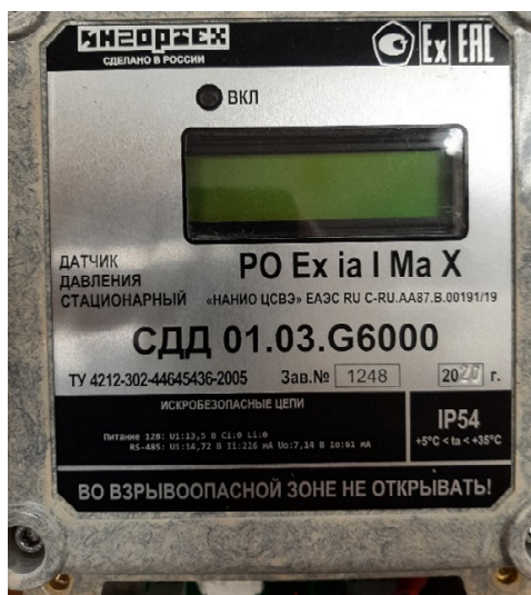
Рисунок 2 - Общий вид таблички (на примере СДД 01) с указанием заводского номера