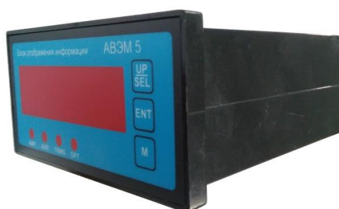
Рисунок 9 – Общий вид блока индикации АВЭМ 5