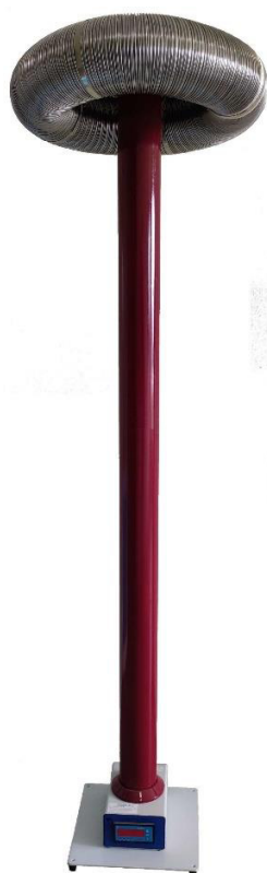
Рисунок 4 – Общий вид модификации КВМ-220