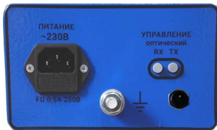
Рисунок 7 – Блок измерительный, вид сзади (с дополнительным разъемом питания 12 В)