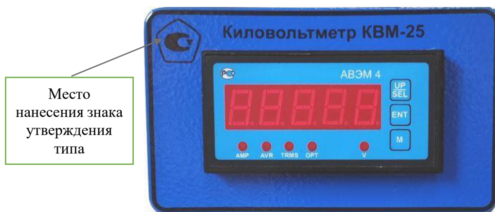
Рисунок 5 – Блок измерительный, вид спереди