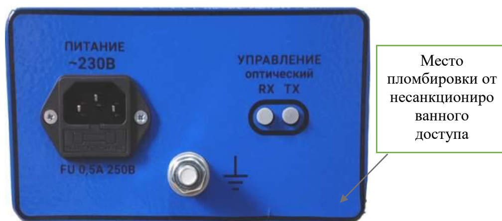
Рисунок 6 – Блок измерительный, вид сзади (без дополнительного разъема питания 12 В)