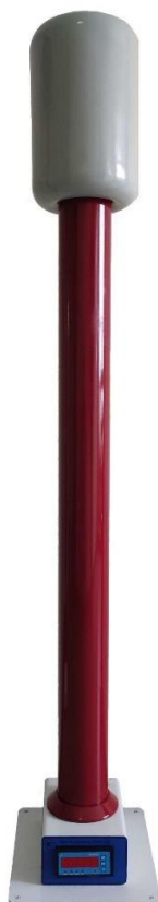
Рисунок 3 – Общий вид модификаций КВМ-150