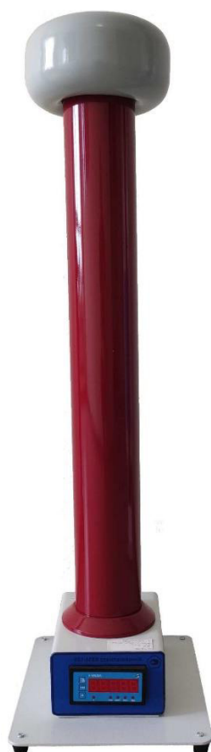
Рисунок 2 – Общий вид модификаций КВМ-100, КВМ-125