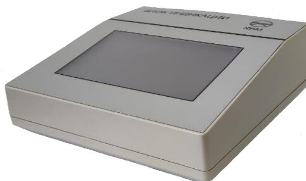
Рисунок 8 – Общий вид блока индикации БИ-1