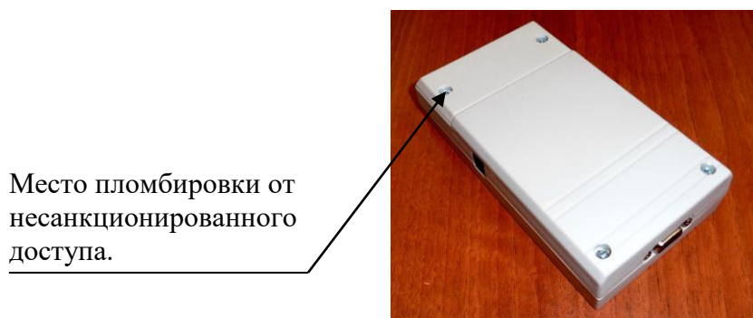
Рисунок 2 - Место пломбировки от несанкционированного доступа.