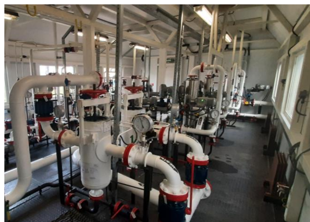
Рисунок 1 – Общий вид СИКН