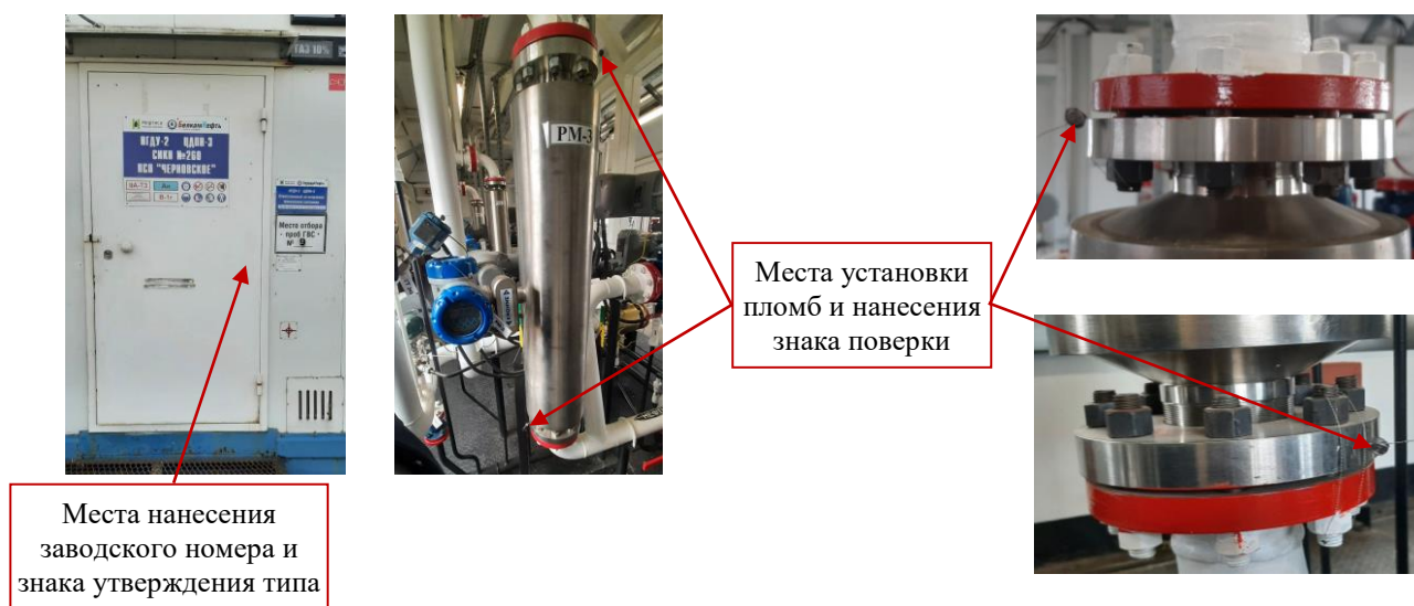
Рисунок 2 – Места нанесения заводского номера, знака утверждения типа, знака поверки и места установки пломб