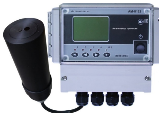
б) настенный контроллер с проточным датчиком