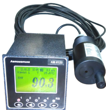
а) щитовой контроллер с погружным датчиком