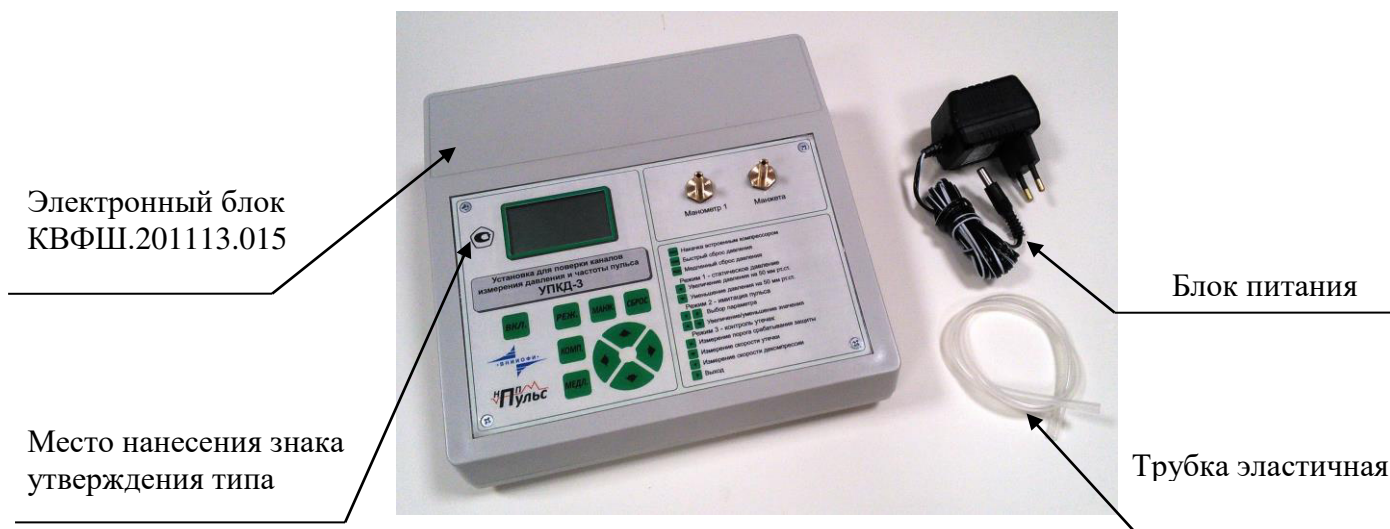
Рисунок 1 - Общий вид УПКД-3

Общий вид УПКД-3 и схема пломбировки представлены на рисунках 1 - 2.