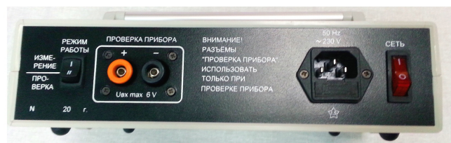
Рисунок 1 - Общий вид средства измерений