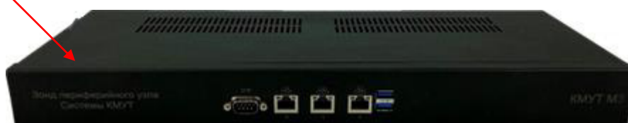
Рисунок 4 – Внешний вид зонда КМУТ модификаций КМУТ М3