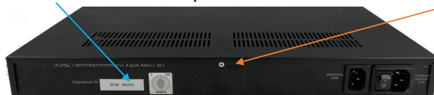
Рисунок 7 – Внешний вид задней панели зонда КМУТ модификаций КМУТ-ПУ М1