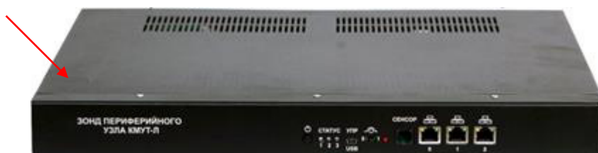
Рисунок 8 – Внешний вид зонда КМУТ модификаций КМУТ-Л