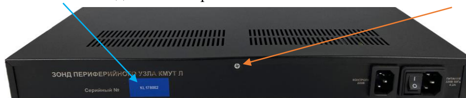
Рисунок 9 – Внешний вид задней панели зонда КМУТ модификаций КМУТ-Л