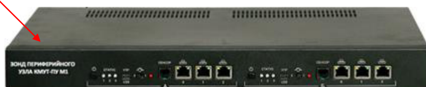
Рисунок 6 – Внешний вид зонда КМУТ модификаций КМУТ-ПУ М1