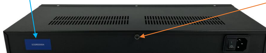
Рисунок 3 – Внешний вид задней панели зонда КМУТ модификаций КМУТ М1, КМУТ М2