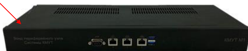
Рисунок 1 – Внешний вид зонда КМУТ модификаций КМУТ М1