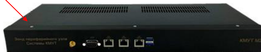
Рисунок 2 – Внешний вид зонда КМУТ модификаций КМУТ М2