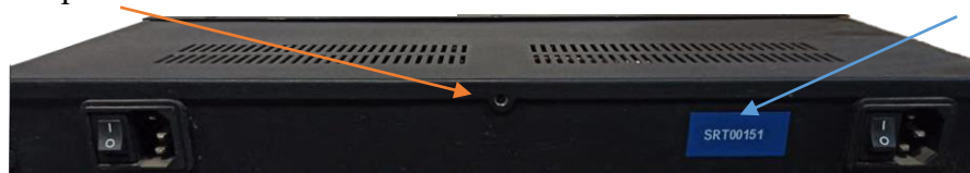
Рисунок 5 – Внешний вид задней панели зонда КМУТ модификаций КМУТ М3