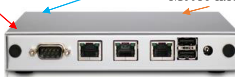
Рисунок 11 – Внешний вид зонда КМУТ модификаций КУТ М1