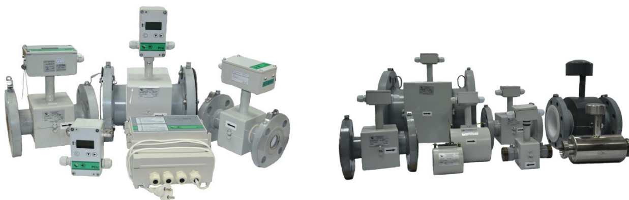
Рисунок 1 - Общий вид расходомеров-счетчиков электромагнитных РСЦ

Схема пломбировки от несанкционированного доступа измерительного блока расходомеров-счетчиков электромагнитных РСЦ (рис.2а) осуществляется нанесением знака поверки давлением на свинцовую (пластмассовую) пломбу, которая навешивается на проволоку (кордовую нить), проведенную в отверстия в специальных пломбировочных винтах. Схема пломбировки от несанкционированного доступа, обозначение места нанесения знака поверки электромагнитного преобразователя расхода расходомеров-счетчиков электромагнитных РСЦ осуществляется нанесением знака поверки давлением на свинцовую (пластмассовую) пломбу, которая навешивается на проволоку (кордовую нить) проведенную через специальные пломбировочные отверстия для квадратного типа клеммной коробки (рис.2б), и для круглого типа клеммной коробки (рис.2в) проволока проводится через отверстие в специальном пломбировочном винте. Места пломбирования расходомеров-счетчиков электромагнитных РСЦ приведены на рисунке 2.