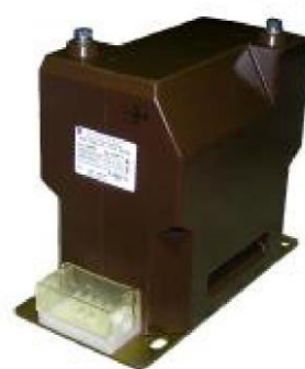
б) модификация НОЛ-СЭЩ-20