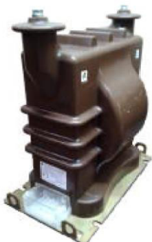
в) модификация НОЛ-СЭЩ-35