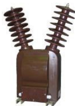
г) модификация НОЛ-СЭЩ-35-IV