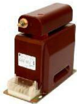
а) модификации НОЛ-СЭЩ-6, НОЛ-СЭЩ-10