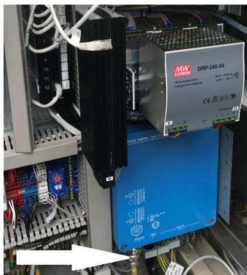
Рисунок 2 – Схема пломбировки от несанкционированного доступа модуля обработки и управления