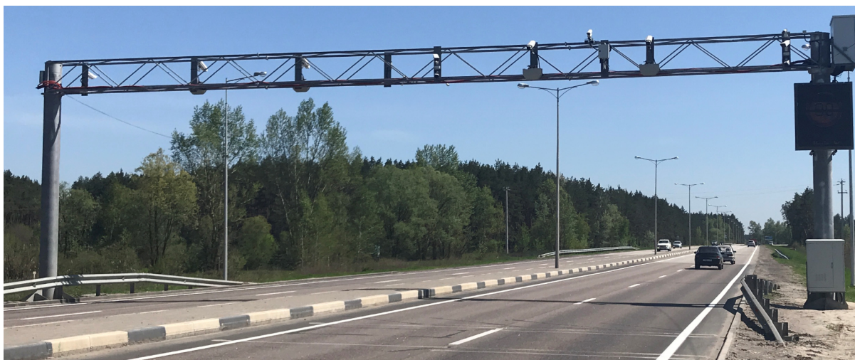
Рисунок 1 – Общий вид комплексов аппаратно-программных автоматических

Комплексы выпускаются в двух вариантах исполнения, различающихся только Модулем измерения габаритных размеров: комплекс «АРХИМЕД» вар. исп. 1 и комплекс «АРХИМЕД» вар. исп. 2 (указывается при заказе).