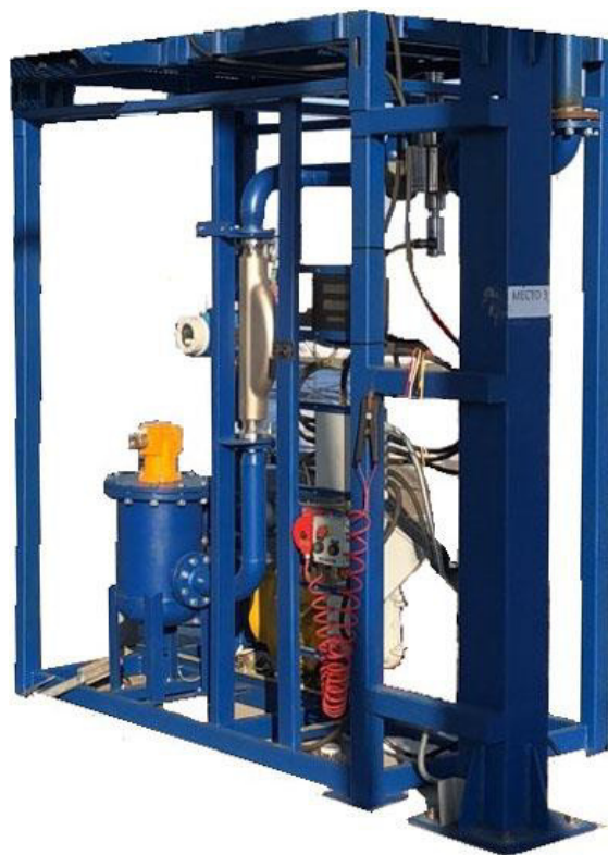
Рисунок 2 - АТНК-МХХХЕ (Исполнение с массомером Promass 83F)