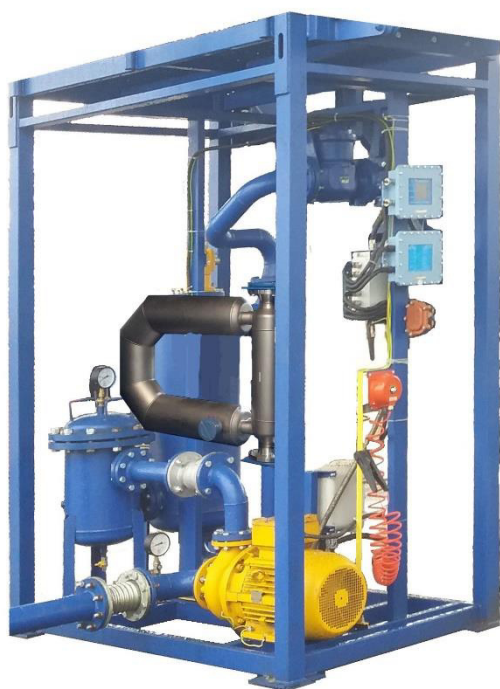
Рисунок 3 - АТНК-МХХХМ (Исполнение с массомером Micro Motion CMF)