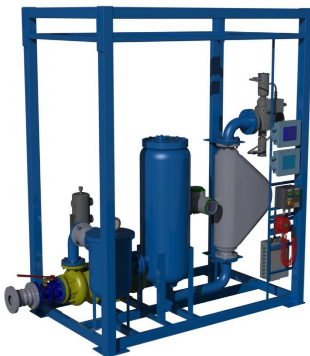
Рисунок 6 – АТНК-МХХХЭ. (Исполнение с массомером ЭМИС-МАСС 260)