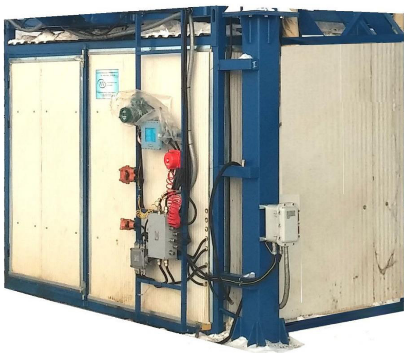
Рисунок 7 – АТНК-XXXXX. Исполнение в блок боксе с обогревом.

Все внешние приборы и соединительные коробки имеют взрывозащищенное исполнение и сертификаты.