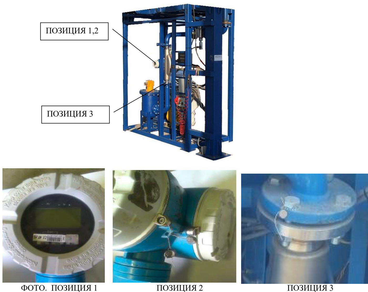
Рисунок 10 – схемы пломбирования АТНК

Схемы пломбирования приведены на рисунках 10 и 11.