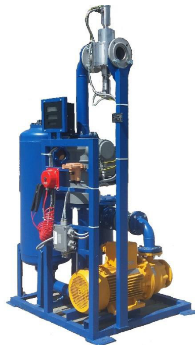
Рисунок 4 - АТНК-ОХХХВ (Исполнение с винтовым счетчиком СЖ-ППВ)