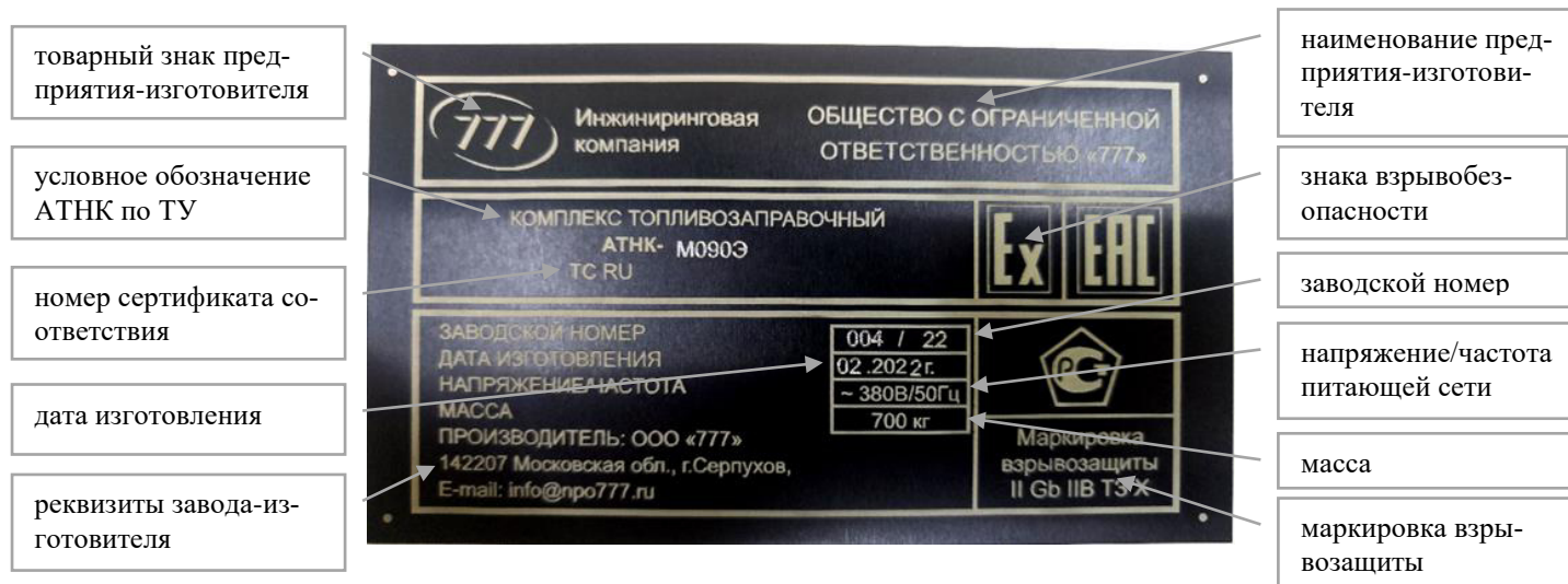
Рисунок 12 – маркировочная табличка АТНК

Маркировочная табличка приведена на рисунке 12.