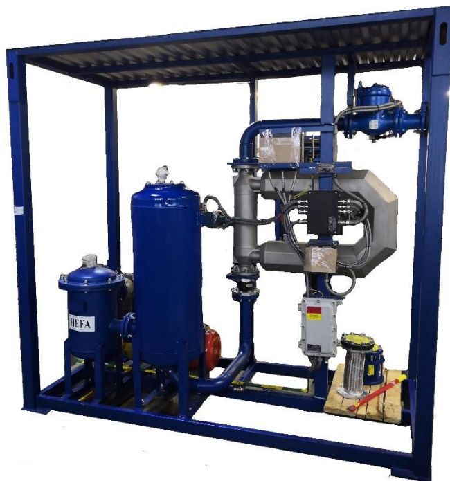
Рисунок 5 – АТНК-МХХХС. (Исполнение с массомером СКАТ)