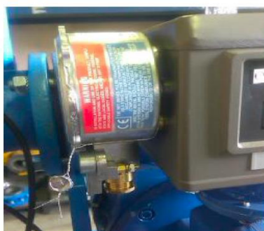
Фото. ПОЗИЦИЯ 1