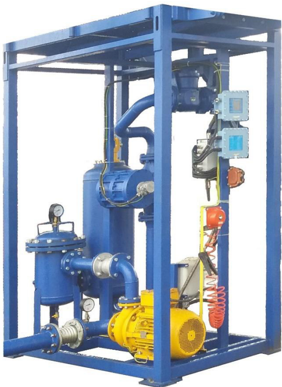
Рисунок 1 - АТНК-ОХХХП (Исполнение со счетчиком жидкости 9501)

Внешний вид АТНК приведен на рисунках с 1 по 6, функциональные схемы СИ АТНК приведены на рисунках 7, 8.