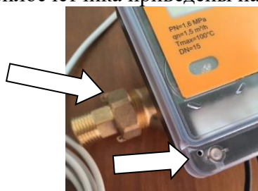
Рисунок 4 Место для пломбы эксплуатации