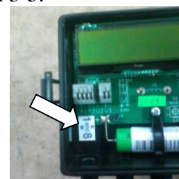
Рисунок 5 – Место для пломбы поверителя