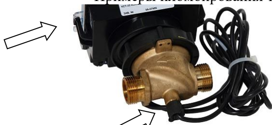
Рисунок 3 - Место для пломбы эксплуатации

Примеры пломбирования теплосчетчика приведены на рисунках 3-5.