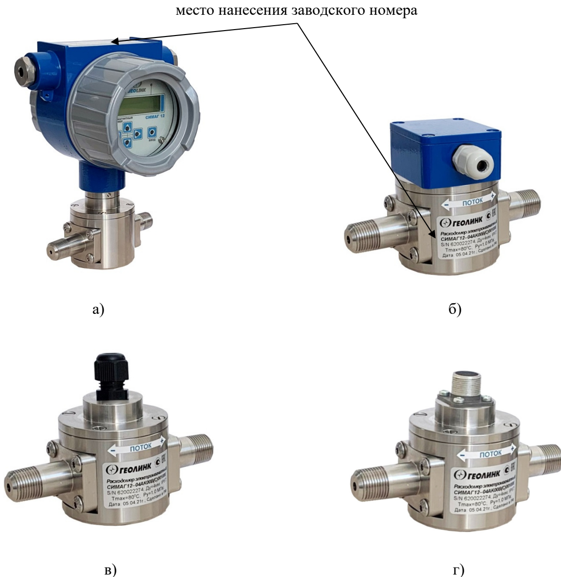
Рисунок 3 – внешний вид расходомеров электромагнитных СИМАГ 12 с Ду до 8 мм. а) компактное исполнение; б, в, г) раздельное исполнение.