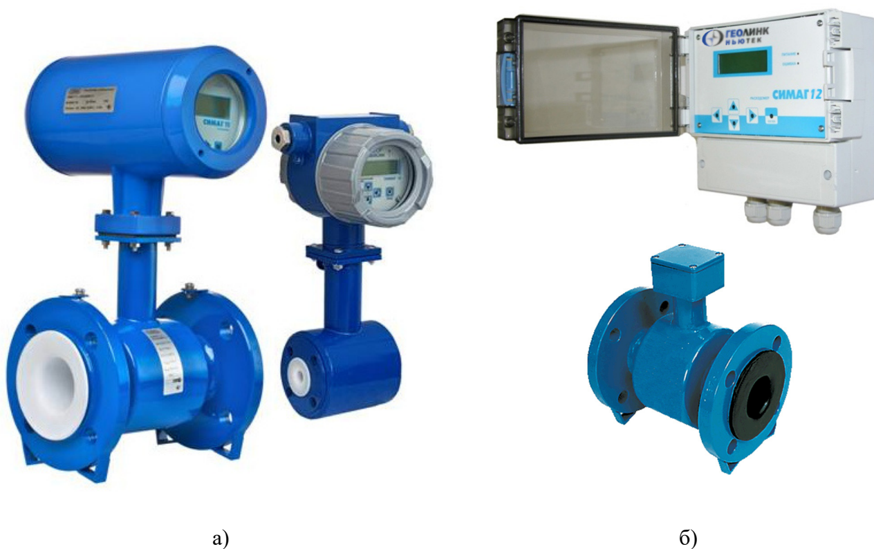
Рисунок 1 – Расходомеры электромагнитные СИМАГ 12: а) компактное исполнение, б) раздельное исполнение