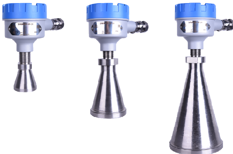
«ЭЛЕМЕР-УР-31/M1» «ЭЛЕМЕР-УР-31/M2» «ЭЛЕМЕР-УР-31/M3»