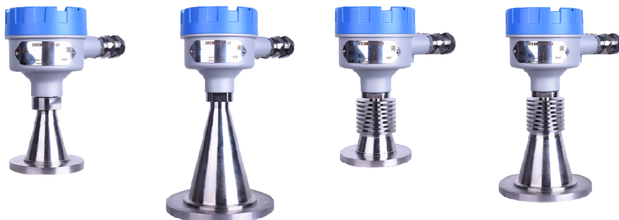
«ЭЛЕМЕР-УР-31/M4» «ЭЛЕМЕР-УР-31/M5» «ЭЛЕМЕР-УР-31/M6» «ЭЛЕМЕР-УР-31/M7»