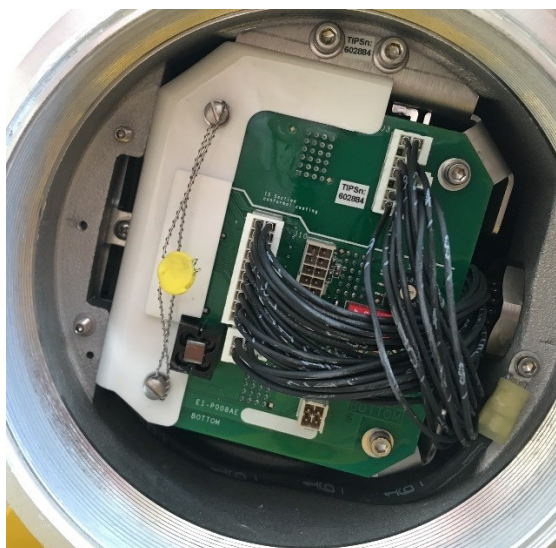
Рисунок 2в – Место установки пломбы, несущей знак поверки – пломбировка аппаратной защиты на материнской плате.