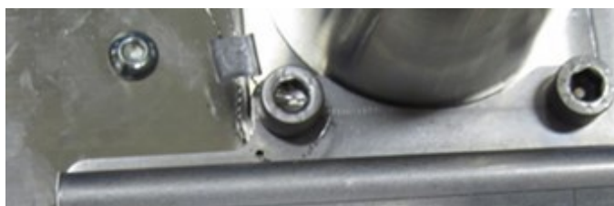
Рисунок 2а – Пломбировка основной маркировочной таблички пломбой завода-изготовителя