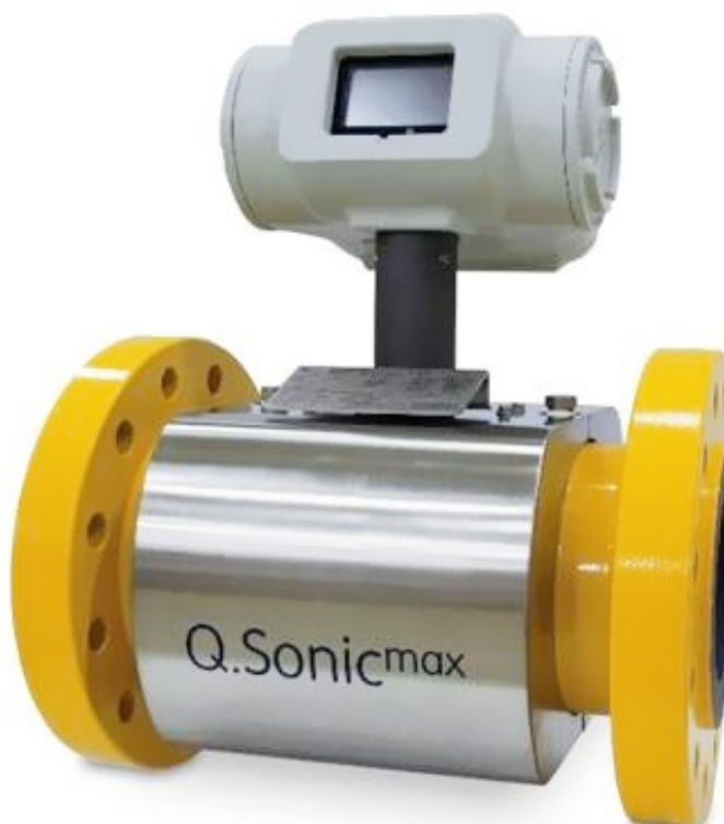
Рисунок 1 – Общий вид расходомера

Общий вид расходомера представлен на рисунке 1.