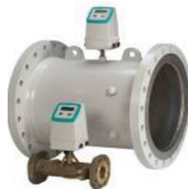
Sitrans F US