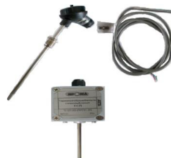
ТСП и ТСП-К