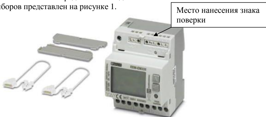
Рисунок 1 – Общий вид приборов для измерения параметров электрической энергии ЕЕМ

Общий вид приборов представлен на рисунке 1.