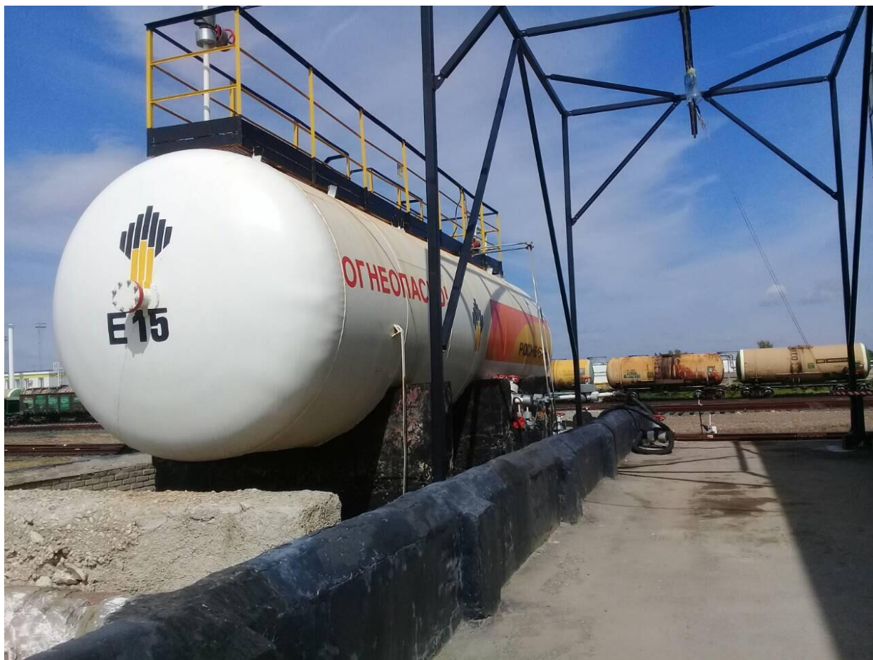
Рисунок 1 - Общий вид резервуара стального горизонтального цилиндрического РГС-80

Общий вид резервуаров стальных горизонтальных цилиндрических РГС-80, РГС-100 представлен на рисунках 1-2.