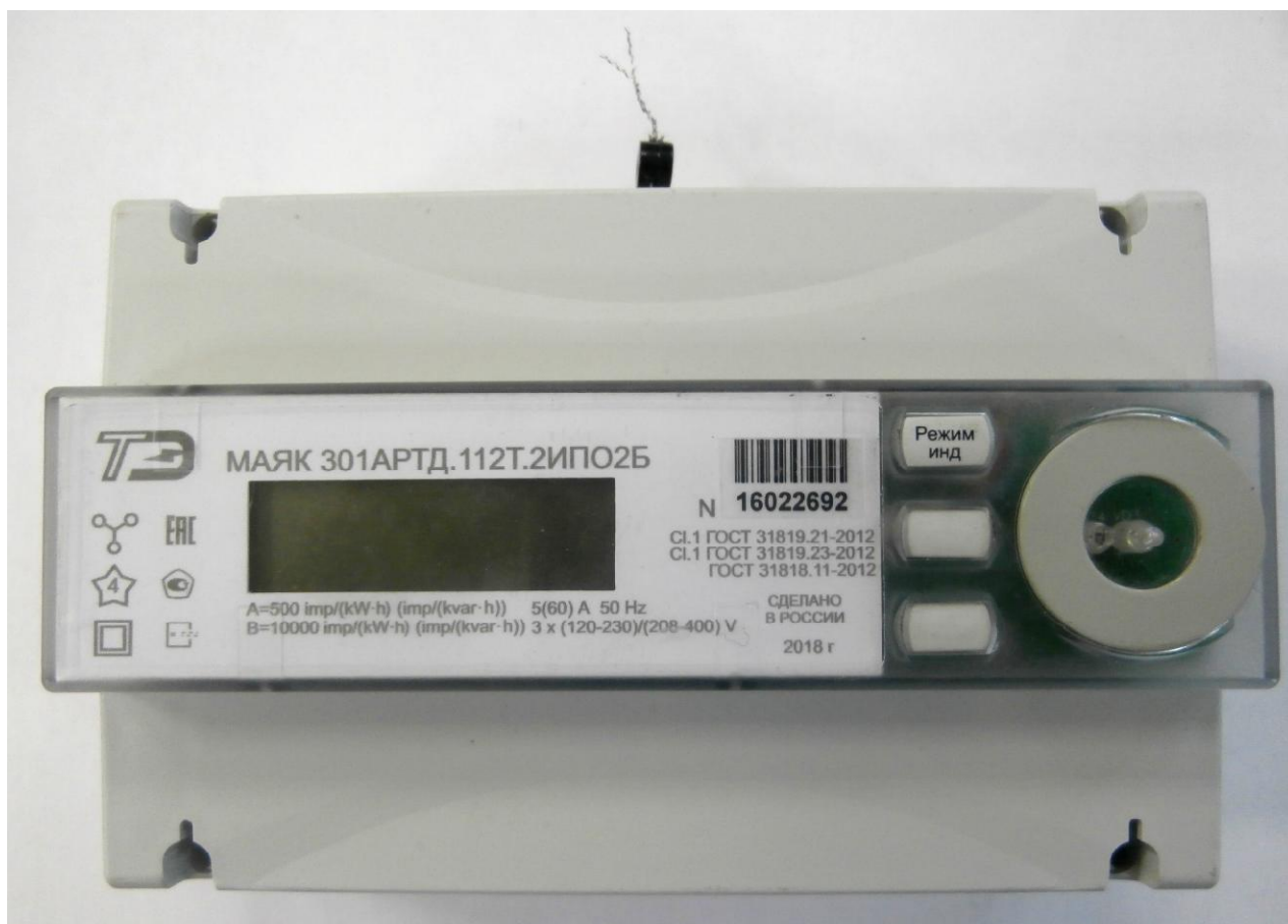
Рисунок 1 – Общий вид счетчика электрической энергии трехфазного статического МАЯК 301АРТД