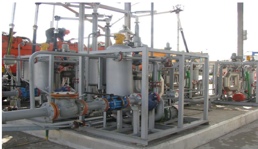
Рисунок 1 – Фотография общего вида установок измерительных АТ-С

Пломбировка от несанкционированного доступа и нанесение знака поверки осуществляется в соответствии с описаниями типов средств измерений, входящих в состав установок измерительных АТ-С.