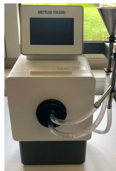
модификация Easy Bev