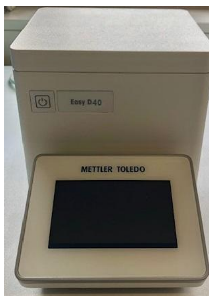
модификация Easy D40