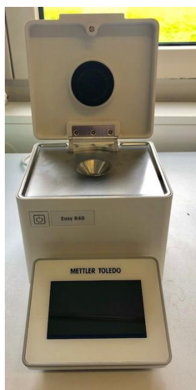
модификация Easy R40