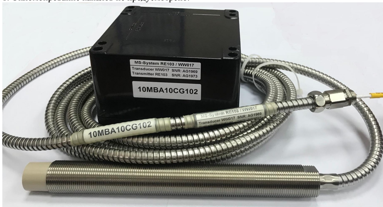
Рисунок 1 - Общий вид каналов измерительных MS-System RE103/WW017

Общий вид каналов измерительных MS-System RE103/WW017 представлен на рисунке 1. Опломбирование каналов не предусмотрено.