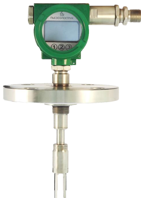
Рисунок 1 - Общий вид ППВ-6,3.У1-Вн модификация «Ф»