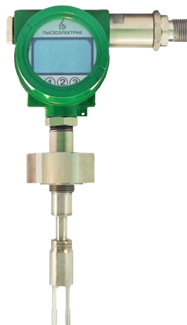
Рисунок 2 - Общий вид ППВ-6,3.У1-Вн модификация «К»