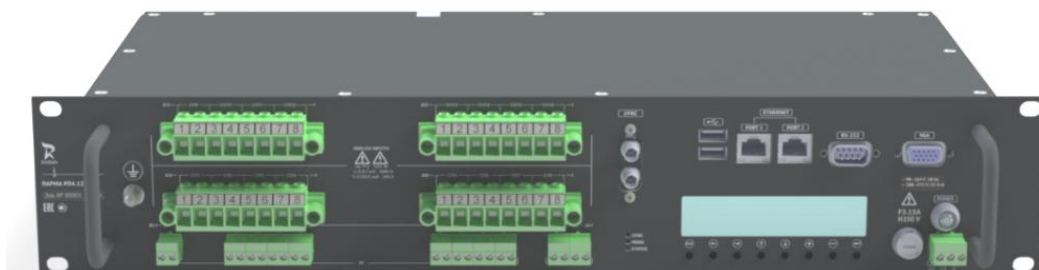
Рисунок 2 – Лицевая панель регистратора в исполнении с двумя оптическими разъемами ST для синхронизации от внешнего сервера точного времени с поддержкой IRIG-B или системы приема и передачи сигналов точного времени «ПАРМА PB9.01»