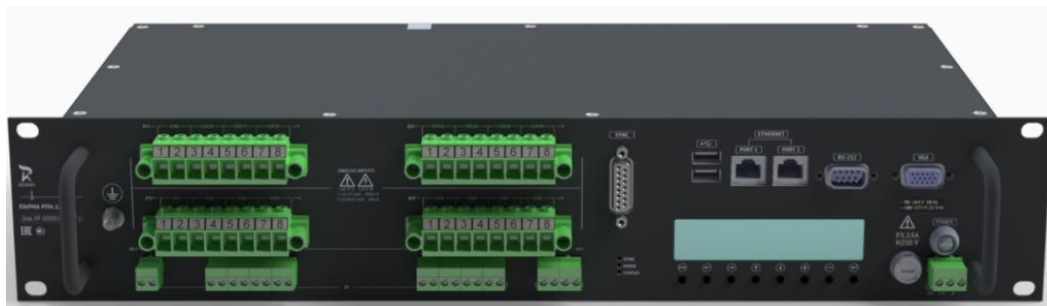
Рисунок 1 – Лицевая панель регистратора в исполнении с разъемом DB-15 для подключения интерфейсного кабеля антенны ГЛОНАСС/GPS или сервера точного времени с поддержкой IRIG-B (TTL)

Схема пломбировки от несанкционированного доступа представлена на рисунке 5.