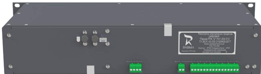
Рисунок 4 – Тыльная панель регистратора в двухстороннем исполнении