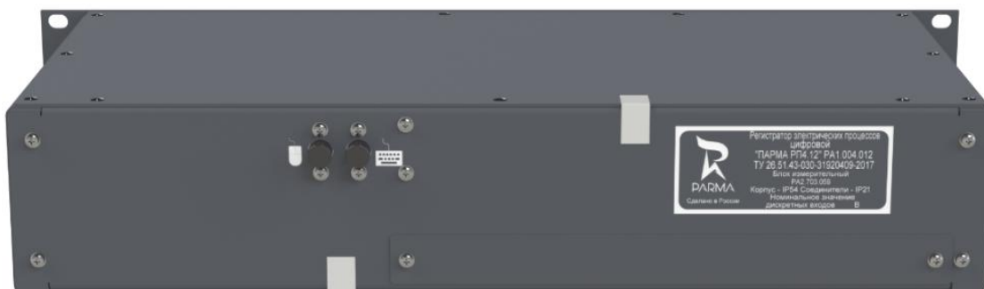
Рисунок 3 – Тыльная панель регистратора в одностороннем исполнении