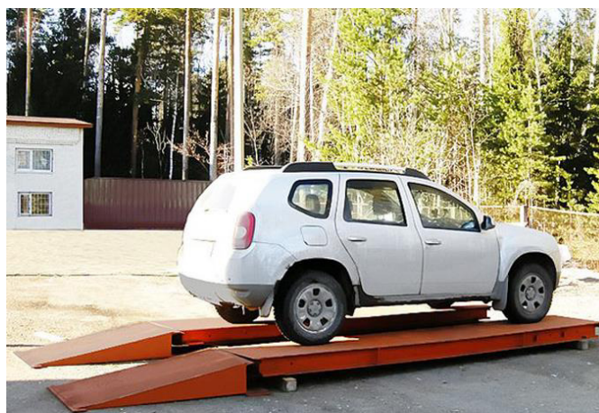
Рисунок 3 - Общий вид модификации весов МВСК П-П

Масса автомобиля в целом определяется при условии одновременного нахождения всех колес автотранспортного средства (далее АТС) на платформах.