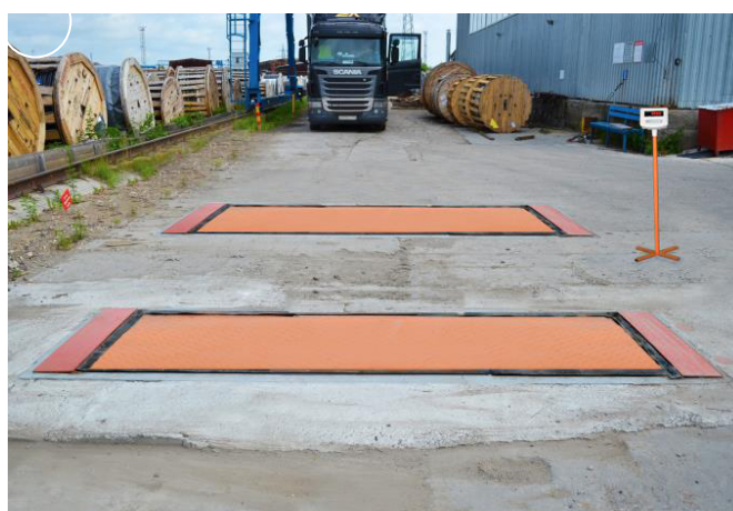
Рисунок 2 - Общий вид модификации весов МВСК П-О