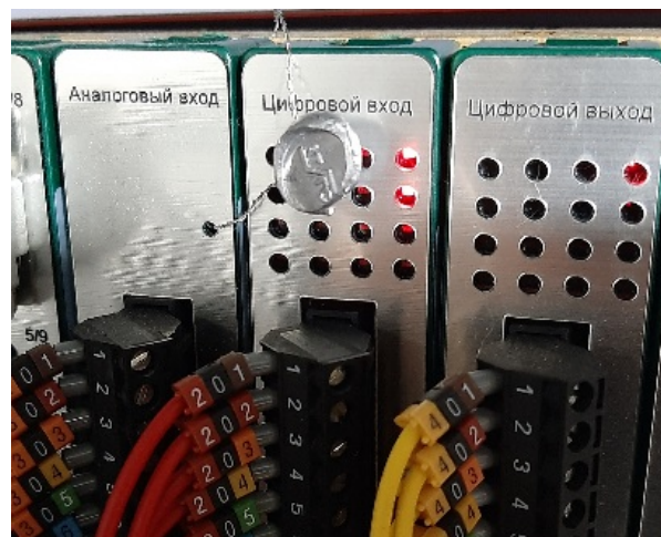
Рисунок 4 – Пломбирование платы аналогового входа контроллера

Места нанесения клейм (наклеек и пломб) на составные части системы изображены на рисунках 5 – 7.