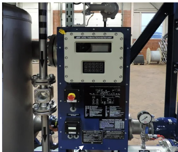
табличка с заводским номером

Внешний вид таблички с заводским номером и место ее расположения изображены на рисунках 8 и 9.