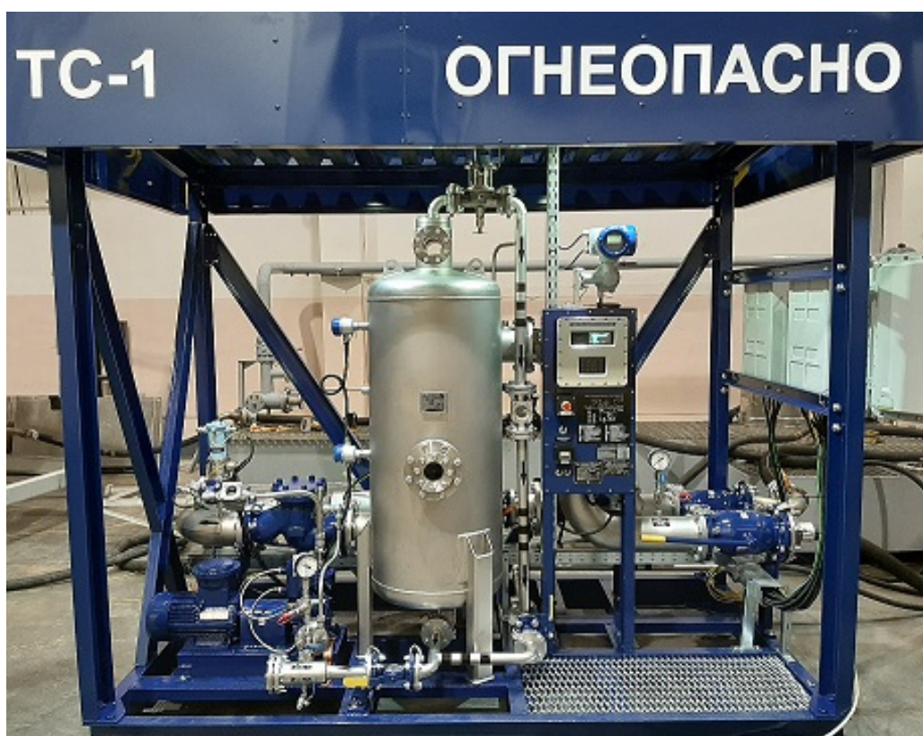
Рисунок 2 – Общий вид системы