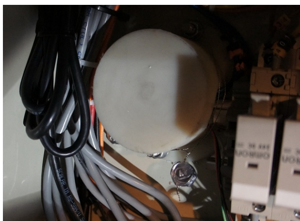
Рисунок 7 –Пломбирование преобразователей температуры PR, ПСТ, ИП 0304/МЗ-Н