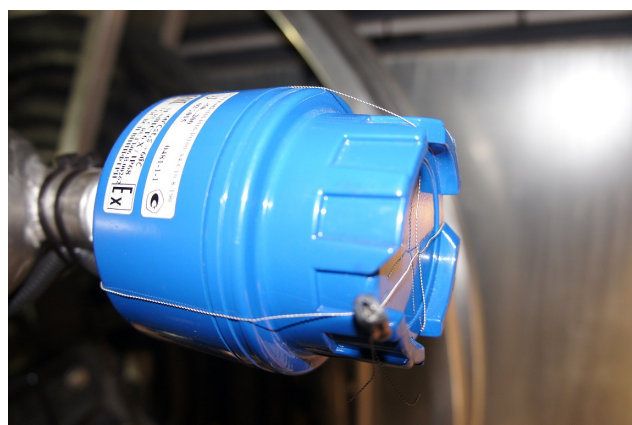
Рисунок 6 – Пломбирование датчика температуры