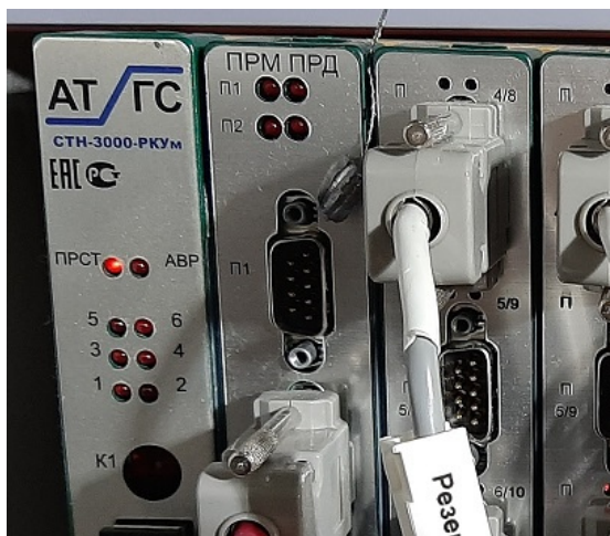
Рисунок 3 – Пломбирование платы центрального процессора контроллера

Места нанесения клейм пломб на контроллер системы изображены на рисунках 3 и 4.