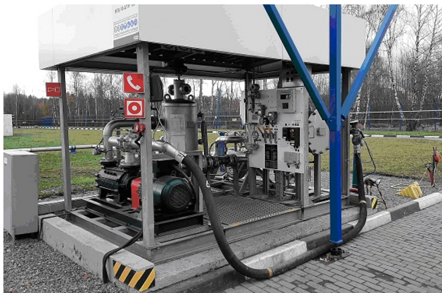
Рисунок 1 – Общий вид системы