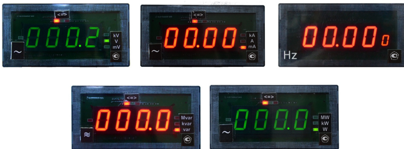
Рисунок 1 – Общий вид приборов в корпусе типоразмера 1

Схема пломбировки от несанкционированного доступа, обозначение мест нанесения знака поверки представлены на рисунке 3.