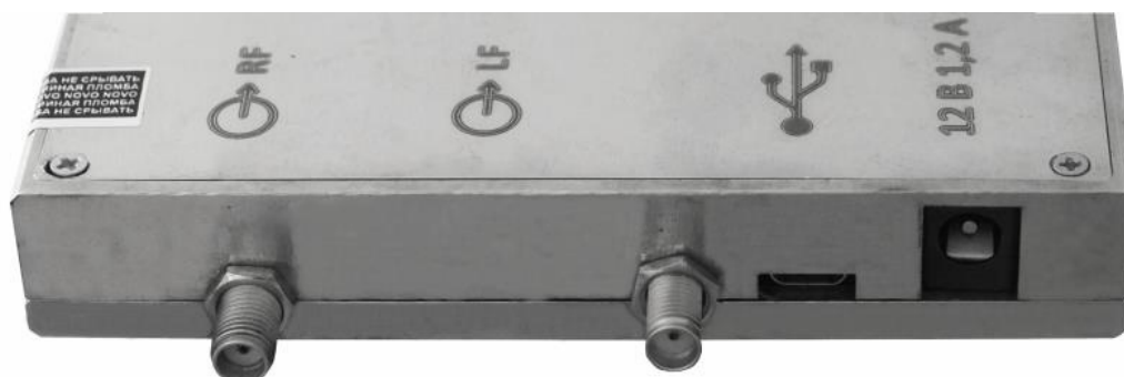
Рисунок 3 – Вид задней панели генератора