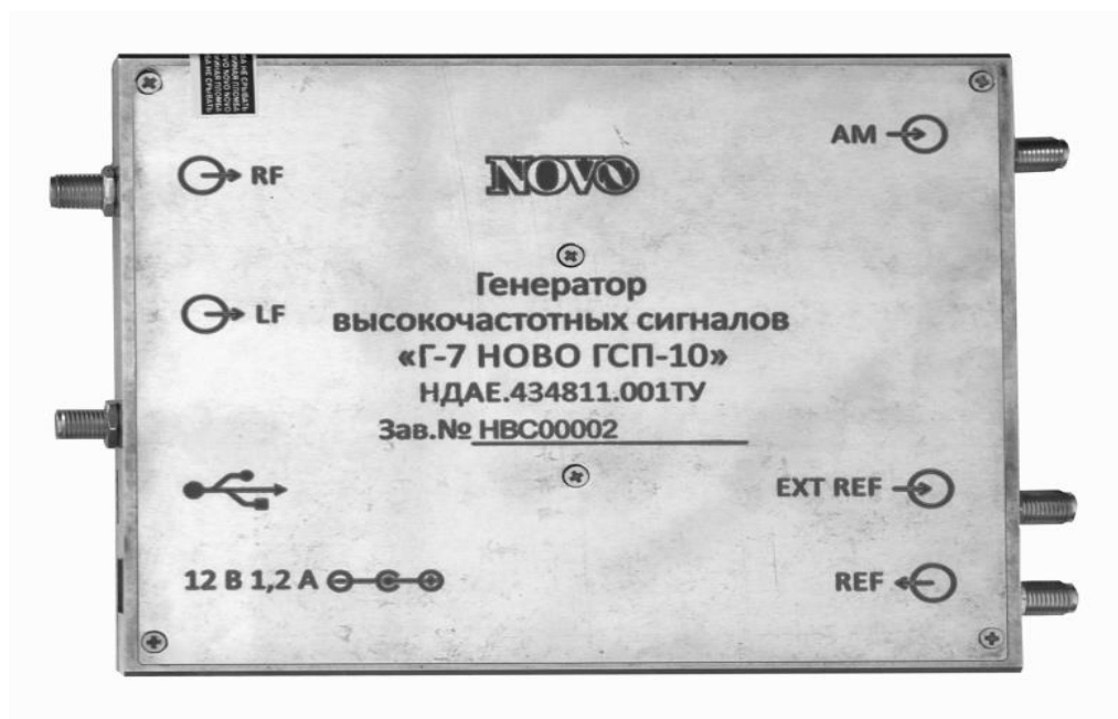
Рисунок 4 – Вид верхней панели генератора

На верхней панели генератора методом гравировки указаны: логотип компании изготовителя (NOVO), полное наименование изделия (генератор высокочастотных сигналов «Г-7 НОВО ГСП-10»), номер ТУ, заводской номер, приведены обозначения входов и выходов прибора расположенных на передней и задней панелях.