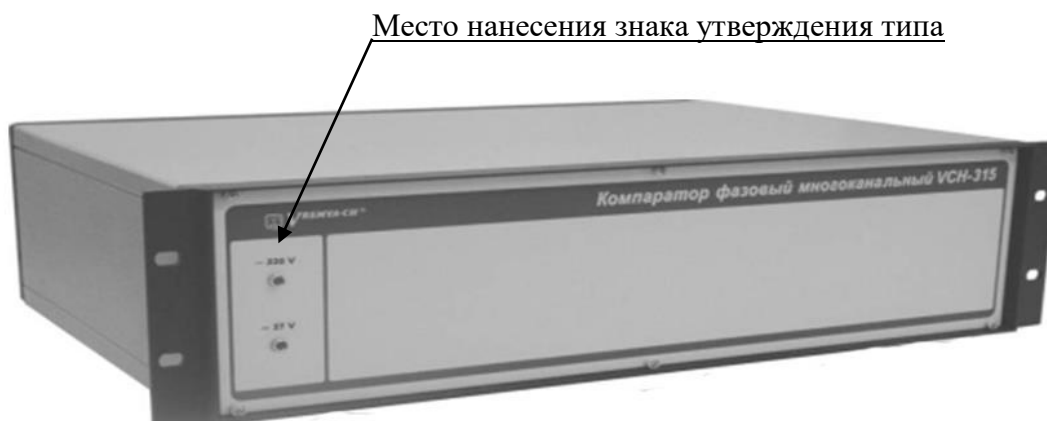
Рисунок 1 – Общий вид компаратора

Заводской номер наносится типографским способом на заднюю панель компаратора и представляет собой последовательность цифр.