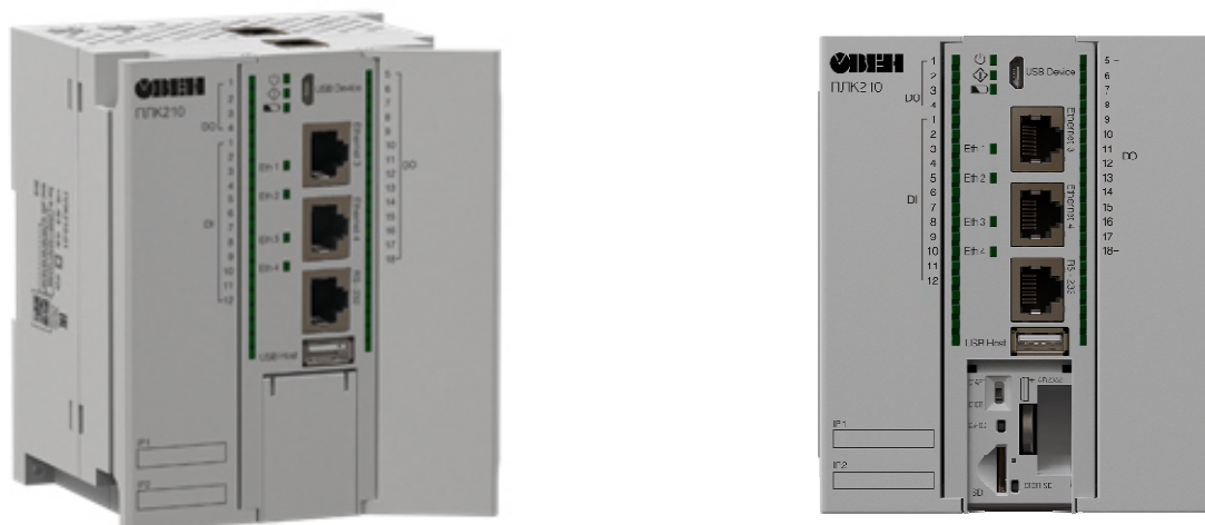
Рисунок 3 – Общий вид контроллеров исполнений ПЛК210-04-X