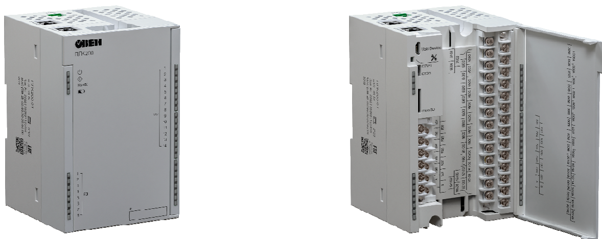
Рисунок 2 – Общий вид контроллеров исполнений ПЛК200-04-X

Общий вид контроллеров представлен на рисунках 2 и 3. Нанесение знака поверки на контроллеры в обязательном порядке не предусмотрено. Пломбирование мест настройки (регулировки) контроллеров не предусмотрено.