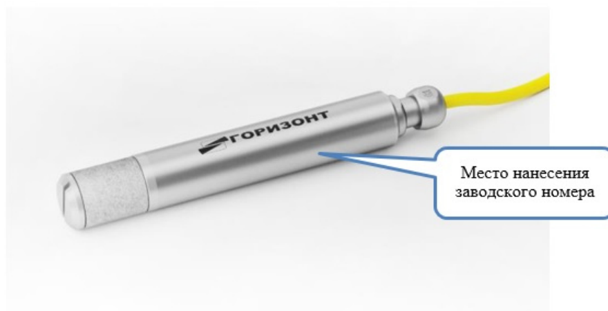
Рисунок 2 - Общий вид датчиков с обозначением места нанесения заводского номера