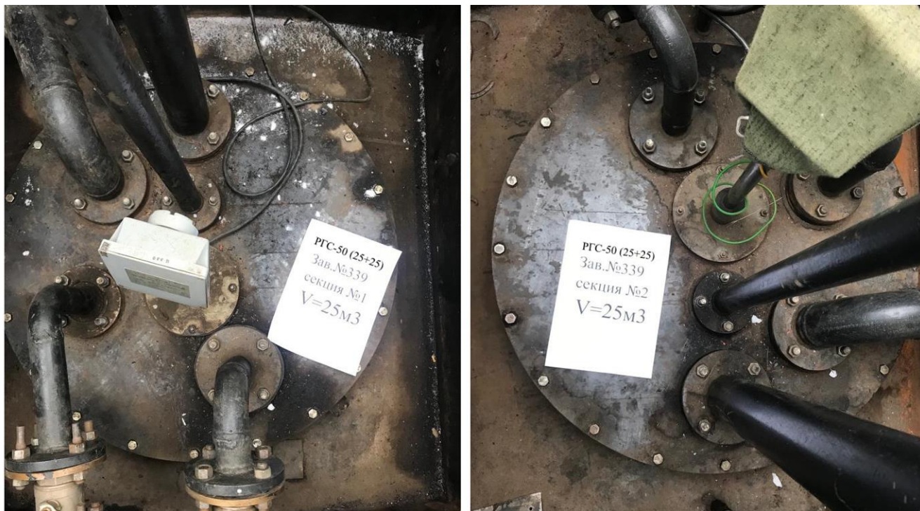
Рисунок 2 – Горловины резервуара РГС-50 (25+25)

Пломбирование резервуара РГС-50 (25+25) не предусмотрено.