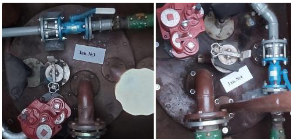
Рисунок 3 – Горловины резервуаров РГС-25 зав.№№ 3, 4

Пломбирование резервуаров РГС-25 не предусмотрено.