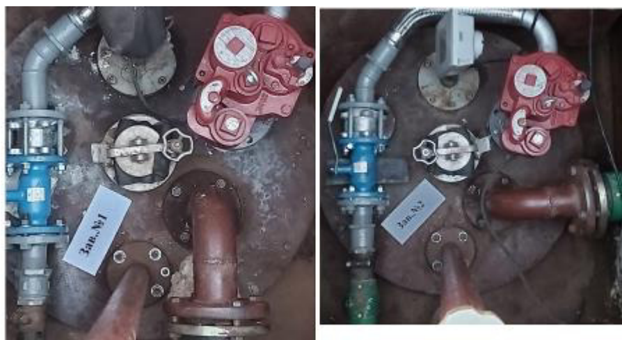
Рисунок 2 – Горловины резервуаров РГС-25 зав.№№ 1, 2