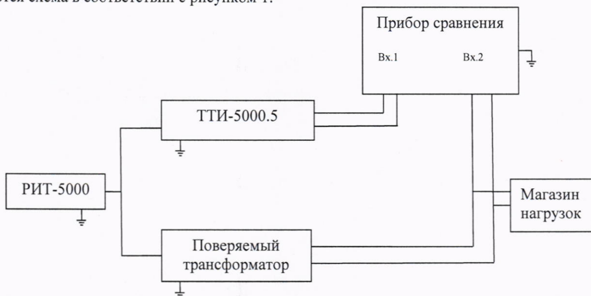
Рисунок 1 – Схема определения токовых и угловых погрешностей трансформаторов классов точности 0,2S; 0,2; 0,5S; 0,5; 1; 3; 5P; 10P; 5PR 10PR

Для трансформаторов классов точности 0,2S; 0,2; 0,5S; 0,5; 1; 3; 5P; 10P; 5PR 10PR собирается схема в соответствии с рисунком 1.