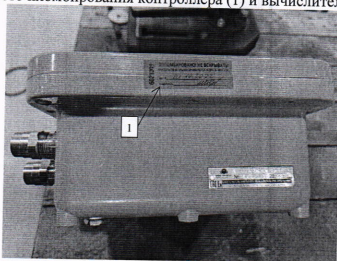
Рисунок Б.2 – Место пломбирования контроллера (1) с исполнением во взрывозащищенном корпусе.