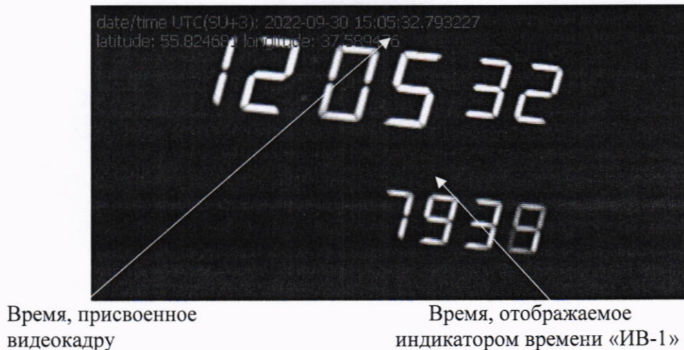
Рисунок 2 – Пример кадра с изображением «ИВ-1»

10.1.4 Для каждой из фотографий сравнить значение шкалы времени детектора T_{фк} и значение шкалы времени УКУС-ПИ 02ДМ T_z (времени, установленного на «ИВ-1»). Определить абсолютную погрешность синхронизации шкалы времени детекторов относительно национальной шкалы координированного времени UTC(SU) как разницу между значениями шкал по формуле (с учетом поясного времени):