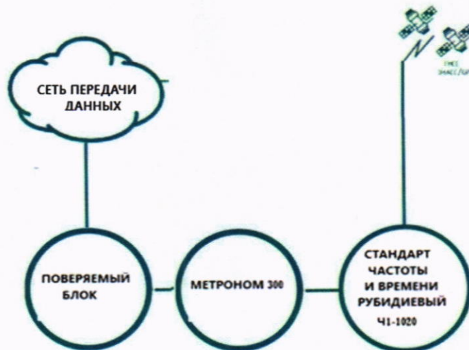
Рисунок 2 – Схема измерения погрешности измерения разности (расхождения) шкал времени

Подключение и работу с оборудованием: стандарт частоты и времени рубидиевый Ч1-1020 и устройство синхронизации частоты и времени Метроном 300 проводить в соответствии с их руководствами по эксплуатации.