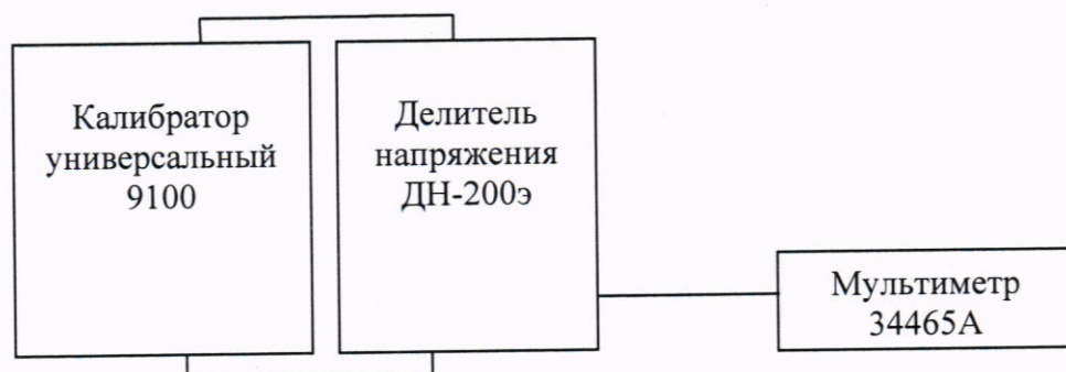
Рисунок 3 - Схема измерений напряжения переменного тока частотой 150 Гц

10.3.4 Произведите измерения напряжений U_{34465\text{А}} на мультиметре 34465А задав с калибратора напряжение переменного тока частотой 150 Гц значением 1000 В. Результаты измерений занесите в таблицу 5.