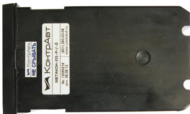
Рисунок 2 – Защита приборов серии МЕТАКОН от несанкционированного вскрытия с помощью одноразовых гарантийных наклеек контроля вскрытия

Для защиты от несанкционированного доступа, после сборки приборов, на их корпусах наклеиваются одноразовые гарантийные наклейки контроля вскрытия, которые самоуничтожаются при несанкционированном вскрытии. Внешний вид приборов с гарантийными одноразовыми наклейками контроля вскрытия приведены на рисунке 2.