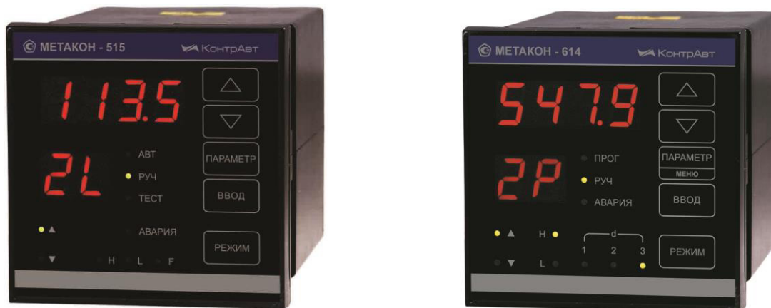
Рисунок 1 – Внешний вид приборов серии МЕТАКОН 5XX, 6XX

Внешний вид приборов МЕТАКОН с конструктивным исполнением в пластмассовом корпусе для щитового монтажа 1/8 DIN (96 × 96) приведен на рисунке 1.