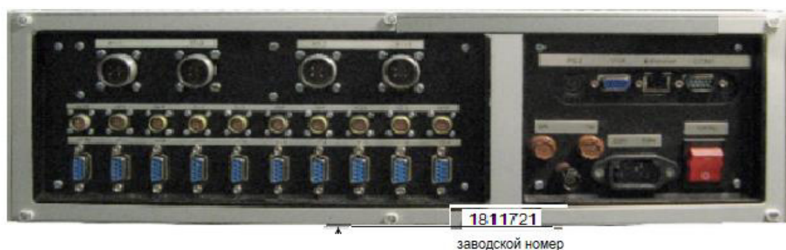
Рисунок 1 – нанесение заводского номера на заднюю панель измерительного блока аппаратуры.

Внешний вид аппаратуры ЛМЗ-97.09С приведен на рисунке 2.