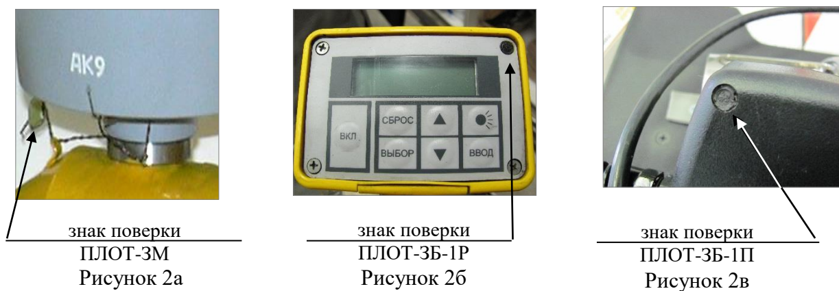
Рисунки 2а, 2б, 2в – Места пломбирования и нанесения знака поверки