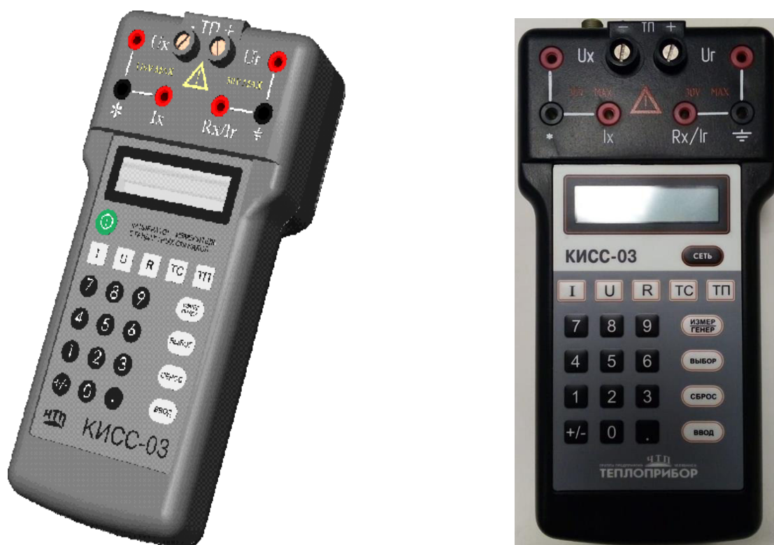
Рисунок 1 – Фотографии общего вида

Место пломбирования приборов от несанкционированного доступа указано на рисунке 2.