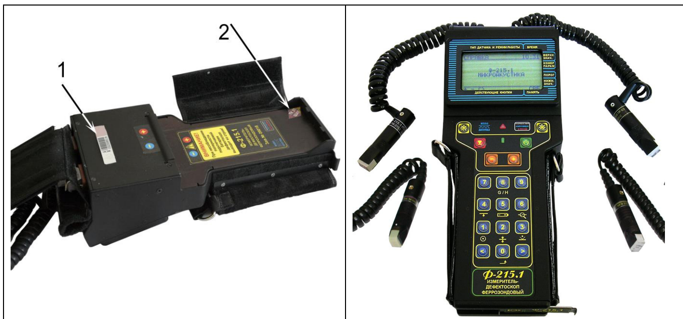
Фото 1 - Общий вид измерителя-дефектоскопа феррозондового Ф-215.1