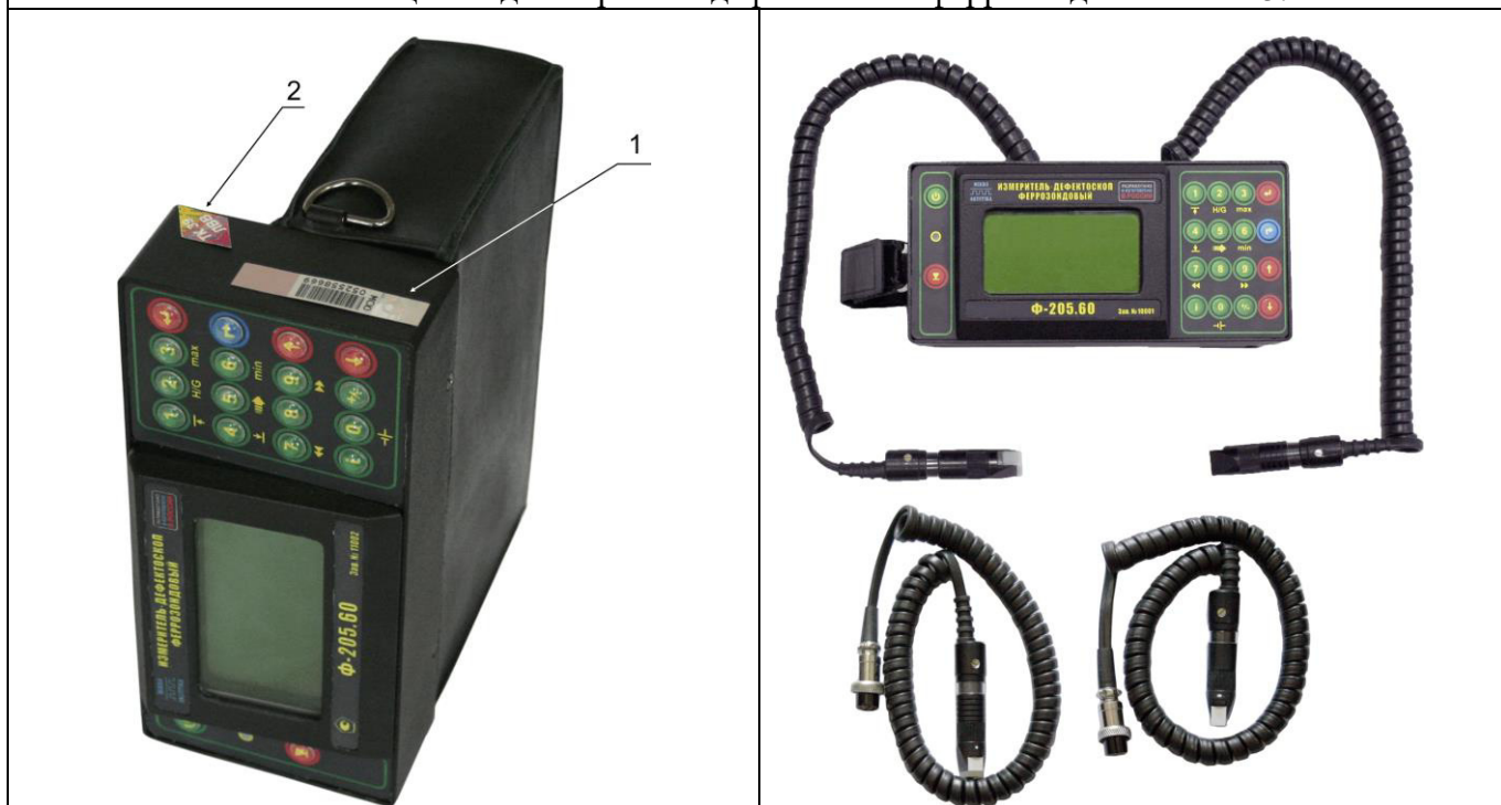
Фото 2 – Общий вид измерителя – дефектоскопа феррозондового Ф-205.60