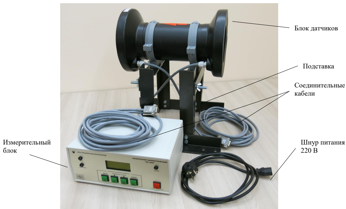
Рисунок 1 – Общий вид регистратора баллистического РБ-1000

Для защиты от несанкционированного доступа выполнено опломбирование корпуса измерительного блока регистратора при помощи наклейки, закреплённой на линии разъёма корпуса. Схема пломбировки от несанкционированного доступа представлена на рисунке 2.