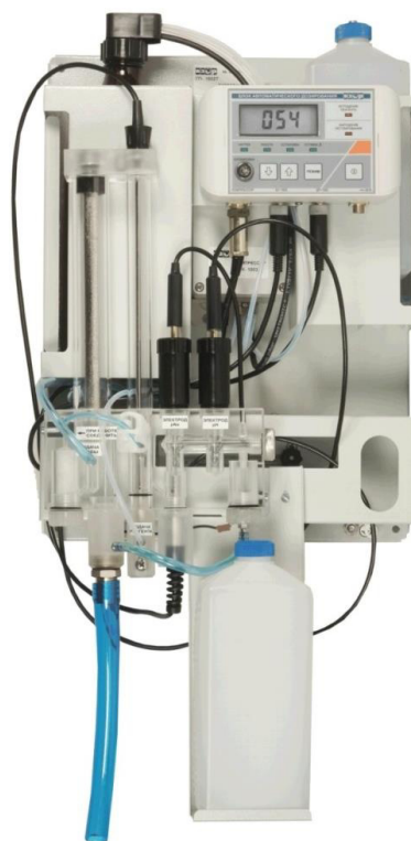
г – Гидропанель ГП-1002Т