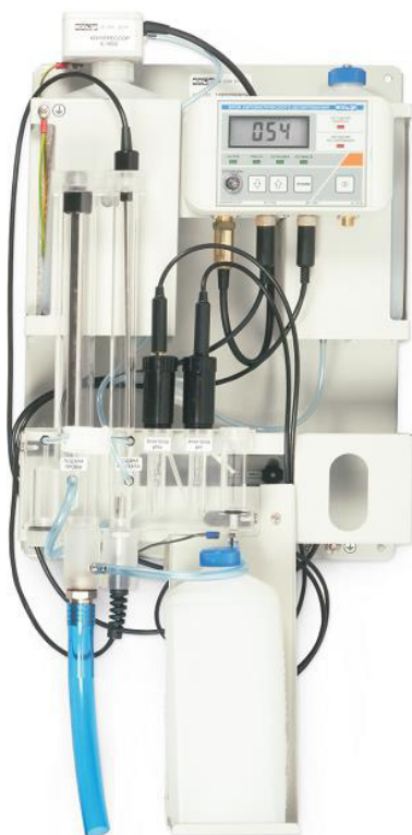
в – Гидропанель ГП-1002